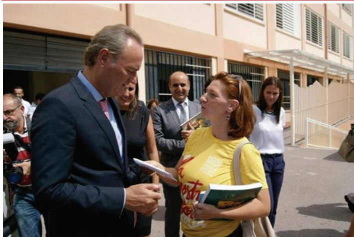
L'alcalde de Godella, amb la samarreta d'Escola valenciana, lliurant al president Fabra les mocions del ple de Godella en contra de la seua política educativa

Un dels fonaments de Compromís és la defensa d'un valencianisme integrador i vertebrador. Per eixe motiu, impulsem i recolzem totes aquelles activitats i actuacions municipals, en favor de la nostra llengua i cultura.