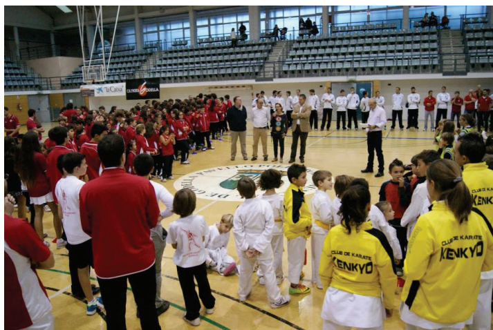
Les escoles i activitats esportives es presten directament per l'Ajuntament

Des de Compromís som partidaris de gestionar de manera pública els serveis públics i per això en les àrees d'esports i educació, que són competència nostra, tots els monitors i professors són contractats laborals, a diferència de la majoria de municipis on ja la gestió és indirecta i la fan empreses privades o autònoms.